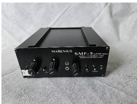
Mikrofonförstärkare SMF-5 mkIII-NEO

Den stora nyheten är vår femte generation av DSP Audio Interface mixer. Den nya mixern har alla funktioner som tidigare, med möjlighet att koppla in mikrofoner och audioutrustning. Den viktigaste nyheten är att den fungerar med både obalanserade och balanserade in- och utgångar. Det innebär att de problem med bland annat brum som drabbat vissa kunder är borta.